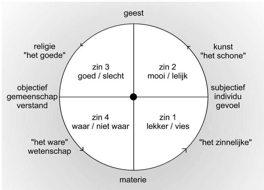
Het zingevingsmodel volgens Gude

schap te noemen in de ware zin des woords. Zij representeert een wetenschap, die een geweten in zich draagt.’ (Tasten naar zinvol contact. p. 14)